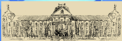
CSÍKSZEREDA POLGÁRMESTERI HIVATALA

Az újság megjelenését támogatta a Csíkszereda Megyei Jogú Város Pogármesteri Hivatala és a Segítő Mária Alapítvány. Köszönjük!