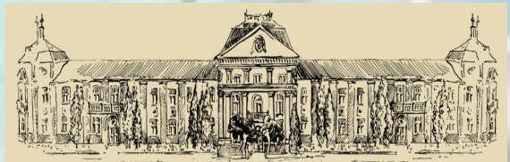
CSÍKSZEREDA POLGÁRMESTERI HIVATALA

Írhattok nekünk a segitodt@yahoo.com -ra.